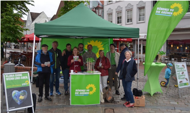
Unser Stand am Böttcher-Rondell zur Europawahl 2019

2019 war das Interesse an unserem Stand groß. Nicht nur, dass wir viele gute Gespräche führten, es waren auch viele Grüne vor Ort. Hoffen wir,